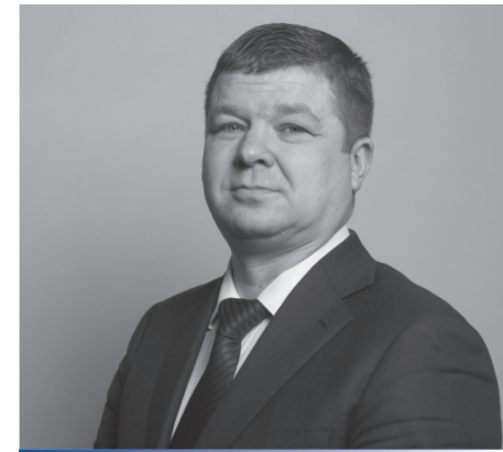
ЗЕЛЕНКИН Игорь, заместитель министра Министерства промышленности и науки Свердловской области